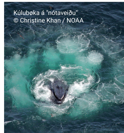
Kúlubøka á "nótaveiðu"

Nakrir stovnar av kúlubøkuni hava ein serligan veiðuhátt. Tær blása bløðrur í sjógvin, sum standa sum veggir ella nót at fiska við, sokallað " bløðrunót ." Tær gera hetta einsamallar ella saman við øðrum kúlubøkum í smáum bólkum at reka fiskin saman í torvu, áðrenn hann verður etin. Hesin veiðuháttur má bæði lærast og venjast, og hetta vísir, at hvalir læra av hvørjum øðrum. Kúlubøkan er nokk ein av teimum heilt fáu hvalasløgum, sum nýtir slík amboð at veiða við.