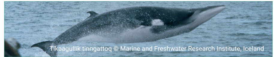
Tikaagullik tinngattoq

Tikaagullit uumasut immikkoortutut marluttut akuerisaasut ilisimaneqarput: tikaagullik nalinginnaasoq, taavalu Antarctic-ip tikaagullia (taamaallaat nunarsuup kujataani uumasuusoq). Tikaagullit uumasut immikkoortut minnerit pingasuupput: Atlantikkup Avannaata tikaagullia, Manerassuup Avannaata tikaagullia, aammalu tikaagullia. Tikaagullit Nunarsuup Avannaata-tungaaniittut taleqqumik qaavatigut ersarissumik qaqortortaqaqamik ilisariuminartuupput.