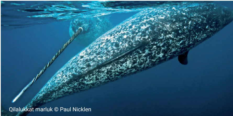
Qilalukkat marluk © Paul Nicklen

Náhvalur Náhvalur Narhval Narhval Narwhal